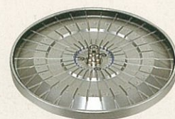
毛細管専用ロータ F-30M 毛細管×30本 回転半径9.2cm