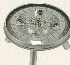
兼用ロータ F-20G 毛細管×20本 回転半径9.2cm 15ml×4本 回転半径10cm