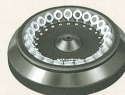
マイクロチューブロータ F-24G 1.5(2)ml×24本 (12,000rpm 13,860×g)